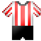
Groote Lindt 3