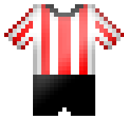
Groote Lindt 4